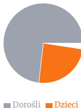
WYKRES 2. STRUKTURA OSÓB OBJĘTYCH POMOCĄ (DZIECI VS DOROŚLI)

Analiza danych pokazuje wyraźną tendencję wzrostową liczby ujawnianych przypadków przemocy.