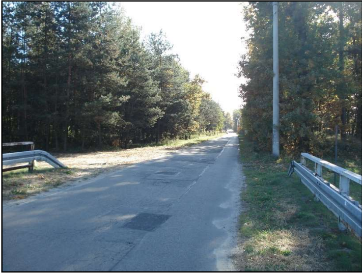
Fot. 13 Ul. Gamrot.