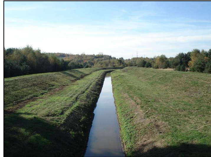
Fot. 12 Nowe koryto Imielinki, widok z ul. E. Romera.