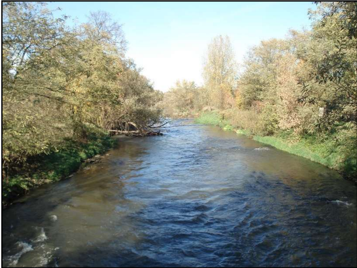
Fot. 9 Przemsza, widok z mostu dla pieszych łączącego Chełm Śląski z gminą Chełmek.