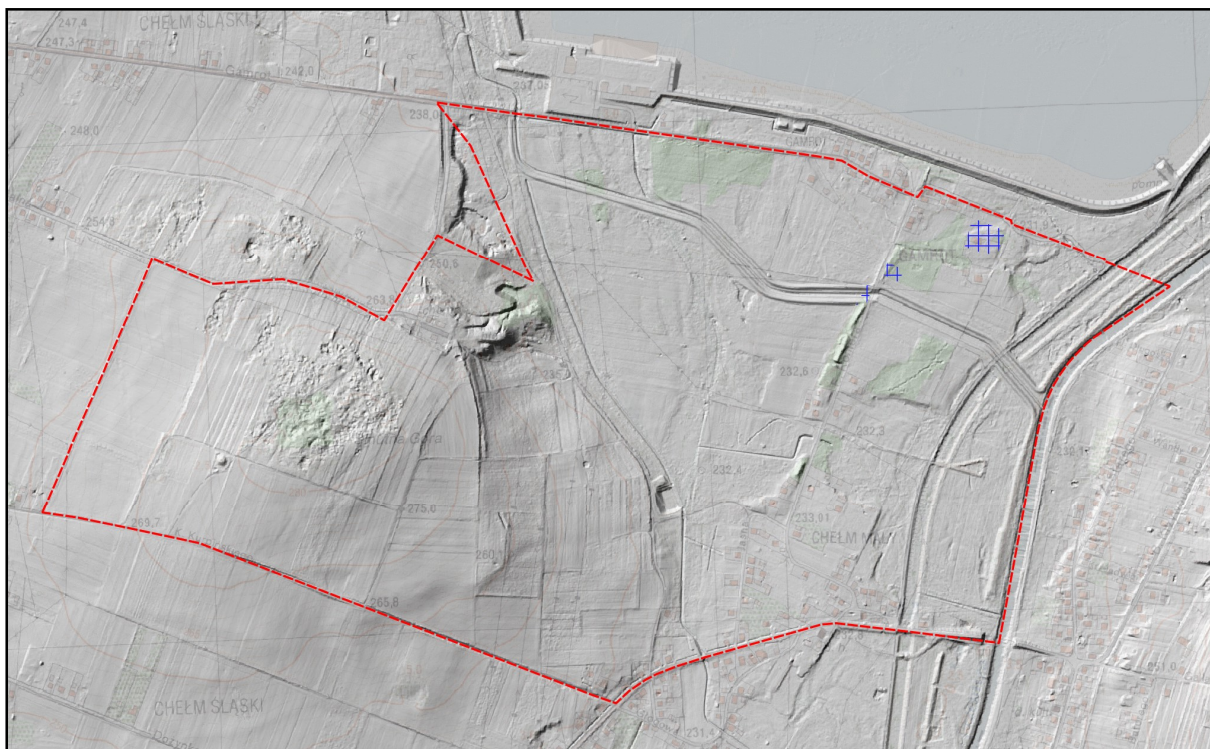
Rysunek 1 Ukształtowanie analizowanego terenu na podstawie Numerycznego Model Terenu.