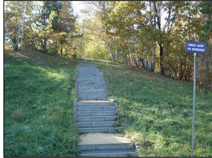
Fot. 15 Dojście do miejsca pamięci po epidemii cholery po wschodniej stronie Smutnej Góry.