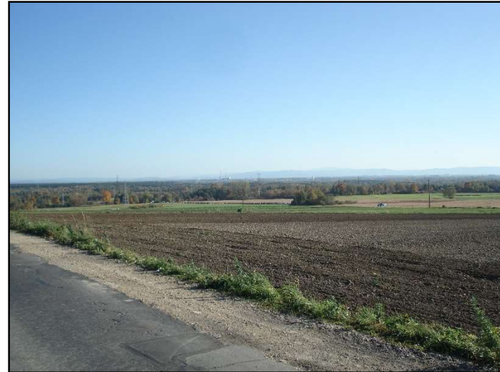
Fot. 20 Widok z ul. K. Kurpińskiego w kierunku południowo-wschodnim, daleko w tle Beskidy i Tatry.