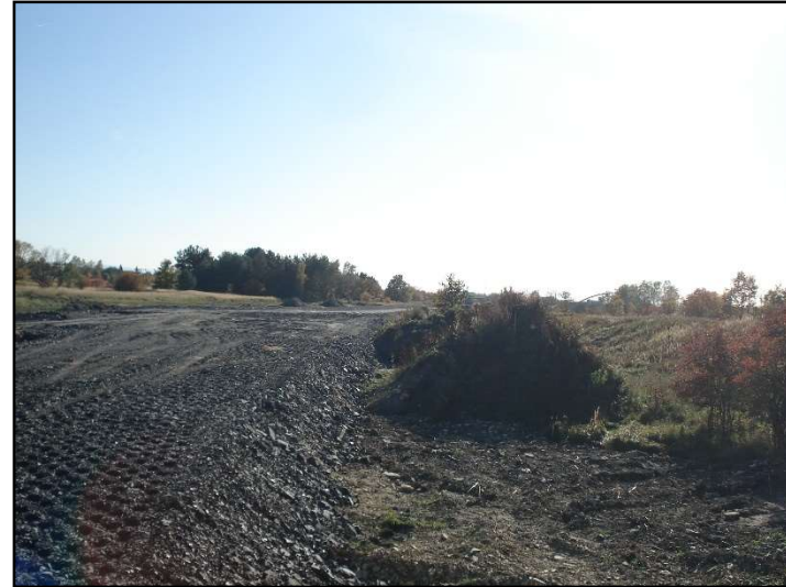
Fot. 11 Budowa wałów przeciwpowodziowych w dolinie Przemszy.