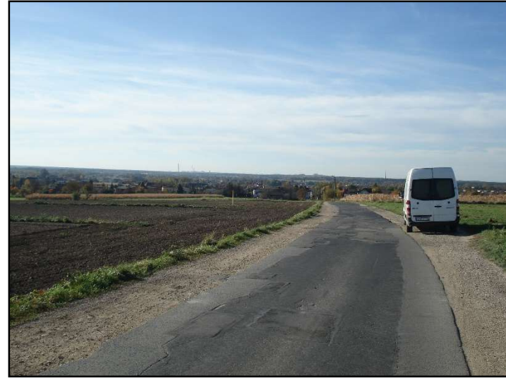
Fot. 19 Widok z ul. K. Kurpińskiego w kierunku zachodnim.