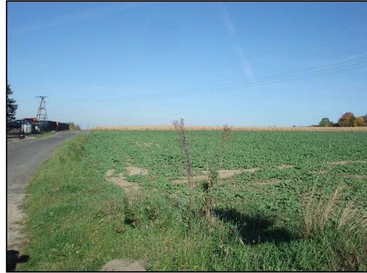
Fot. 3 Droga stanowiąca zachodnią granicę opracowania.