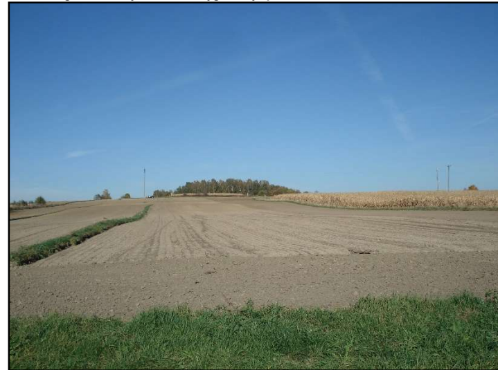
Fot. 4 Smutna Góra widziana od strony południowej z ul. Dożynkowej.