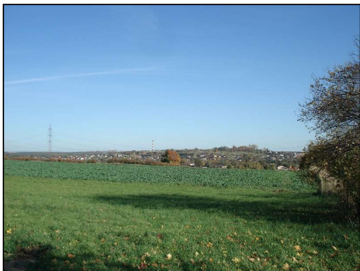
Fot. 5 Widok na Chelmek i Wzgórze Skałka.