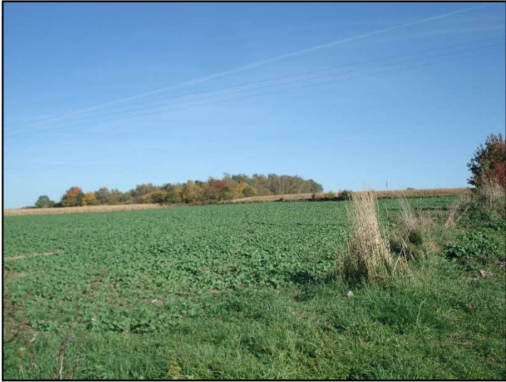
Fot. 1 Smutna Góra, widok od strony południowo-wschodniej.