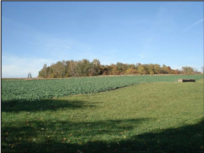
Fot. 18 Widok na wierzchołek Smutnej Góry od strony południowej.