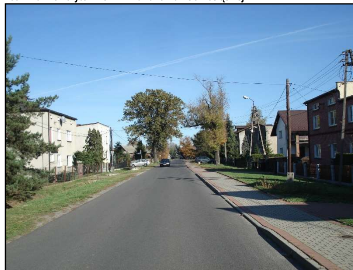
Fot. 8 Ul. Górnośląska.