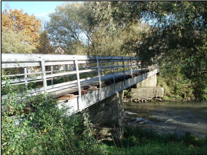
Fot. 10 Most dla pieszych łączący Chełm Śląski z gminą Chełmek.