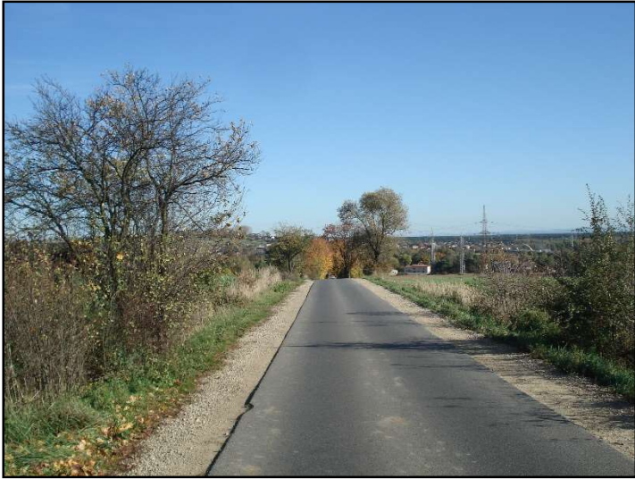
Fot. 17 Widok z ul. K. Kurpińskiego w kierunku wschodnim.