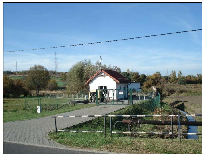
Fot. 7 Dawne koryto Imielinki widziane z ul. Górnośląskiej.