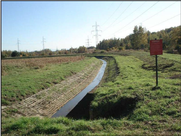
Fot. 14 Imielinka, widok z ul. Gamrot.