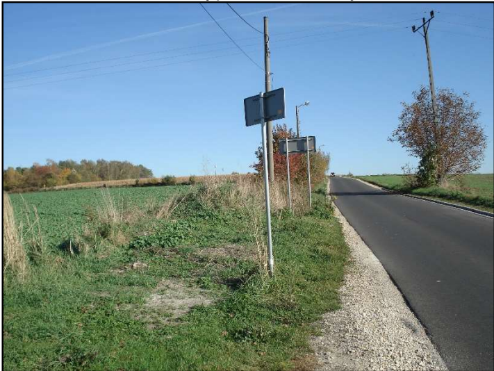
Fot. 2 Ul. K. Kurpińskiego i Smutna Góra widziana od strony południowo-wschodniej.